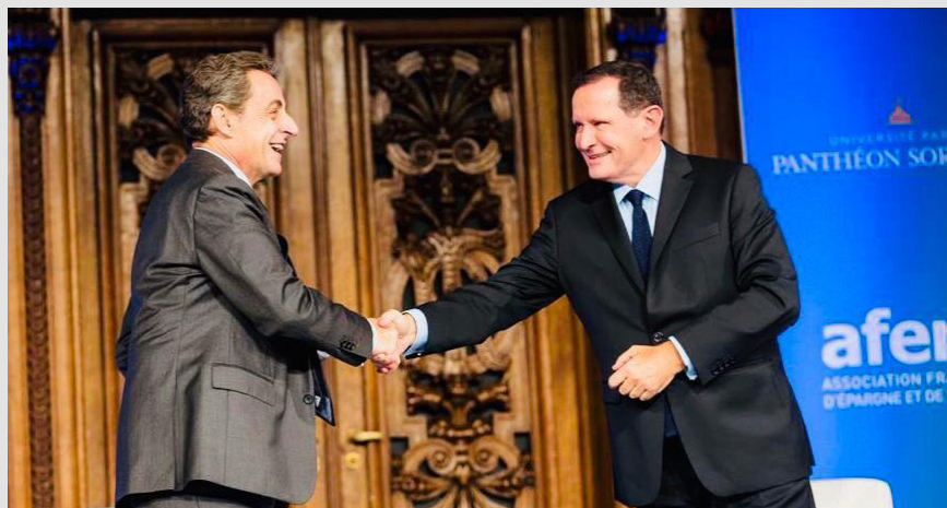
Le Président Nicolas Sarkozy aux Assises de l'Afer, 2016

L'Afer ne fait pas de politique. Elle ne connaît que la politique d'une bonne épargne!