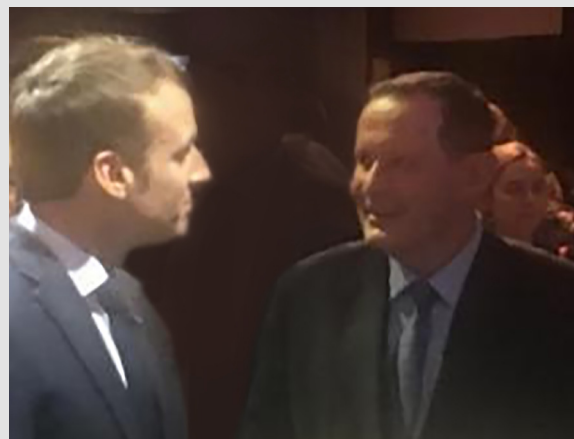
Le Président de la République, Emmanuel Macron, mars 2019