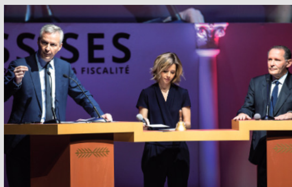
Bruno Le Maire, Ministre de l'Économie et des Finances, aux Assises de l'Afer, 2018