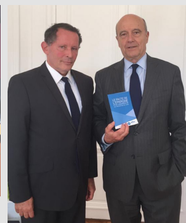
L'ancien Premier Ministre Alain Juppé tenant le Pacte de l'Afer, 2016

Le Président de l'Afer à la rencontre des adhérents dans chaque ville