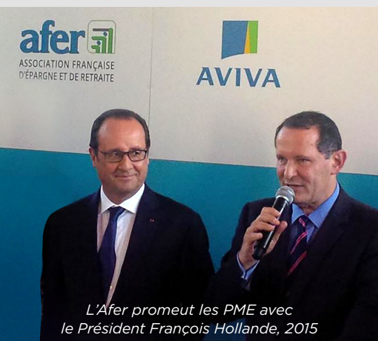
L'Afer promeut les PME avec le Président François Hollande, 2015