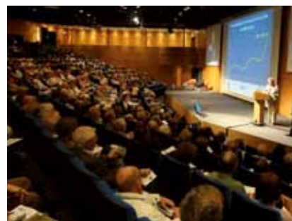
La soirée Afer à Grenoble